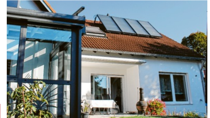
Vier Solarpanels auf dem Dach der Familie Eckel dienen der Heizungs- und Warmwasserunterstützung der neuen Brennwertanlage.

➤ Weitere Infos im Internet www.shk-makosch.de